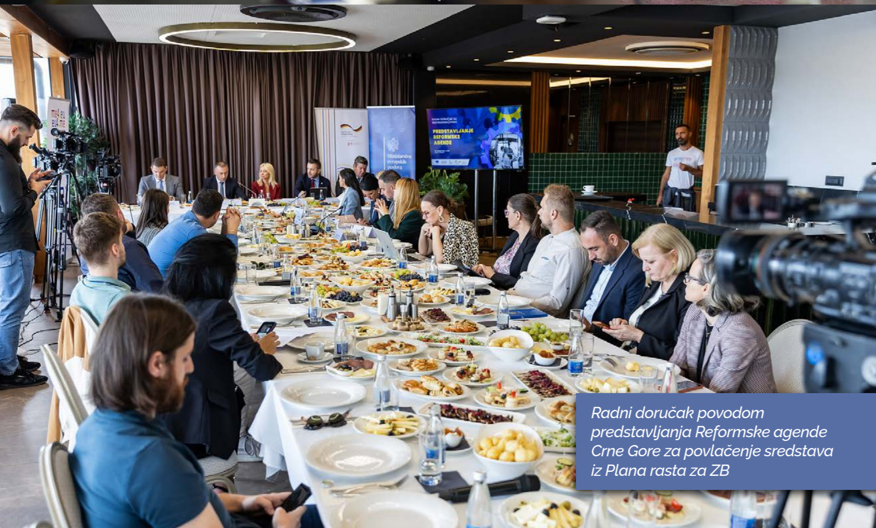
Radni doručak povodom predavljanja Reformske agende Crne Gore za povlačenje sredstava iz Plana rasta za ZB