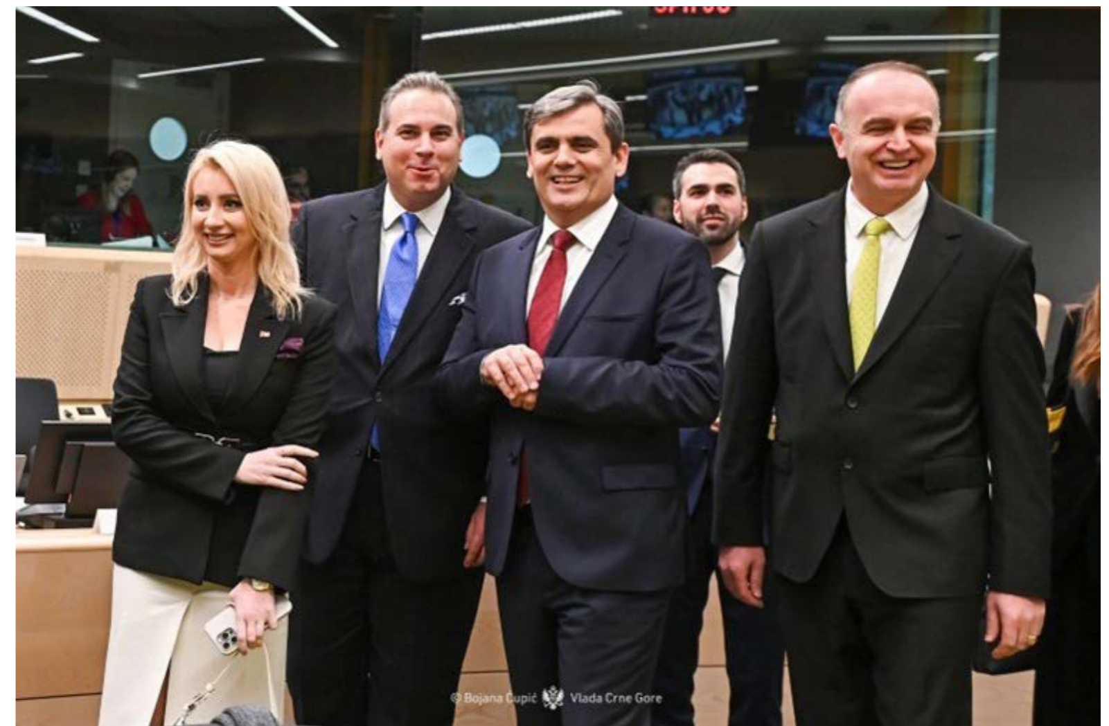
Foto: Međuvladina konferencija, Brisel, 16. decembar 2024.

„Prošle godine Tržišna inspekcija je izvršila preko 800 inspeksijskih kontrola u oblasti prava industrijske svojine, od kojih je u 108 kontrola utvrđeno postojanje povrede žigova. Kada su u pitanju autorsko i srodna prava, najveći broj postupaka, koji ide i do blizu 200 godišnje, vodi se pred Privrednim sudom Crne Gore.