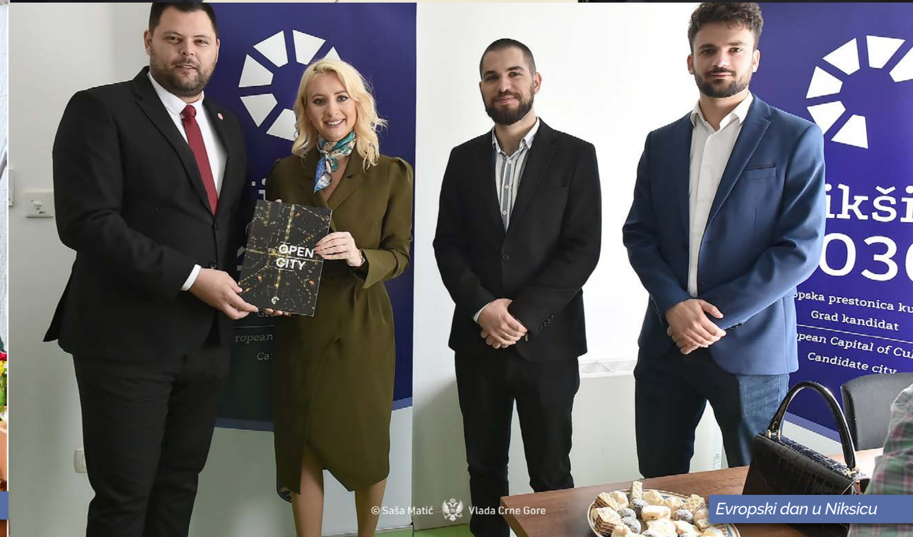
© Saša Matić, Vlada Crne Gore