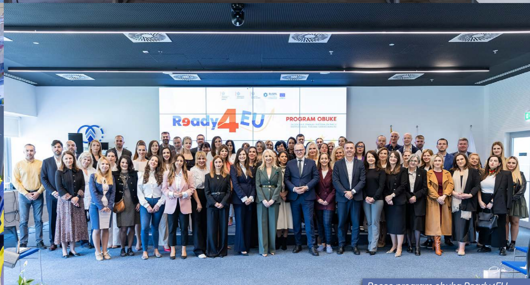
Poceo program obuka Ready4EU