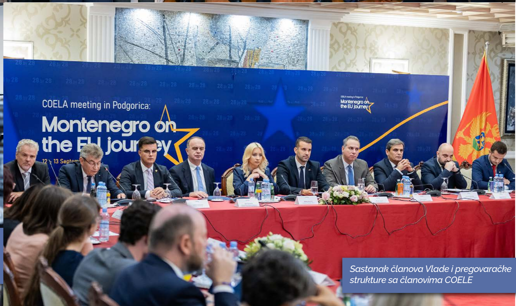
Sastanak članova Vlade i pregovaračke strukture sa članovima COELE