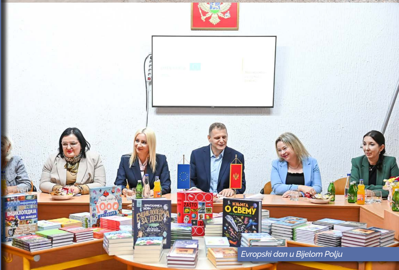
Evropski dan u Bijelom Polju