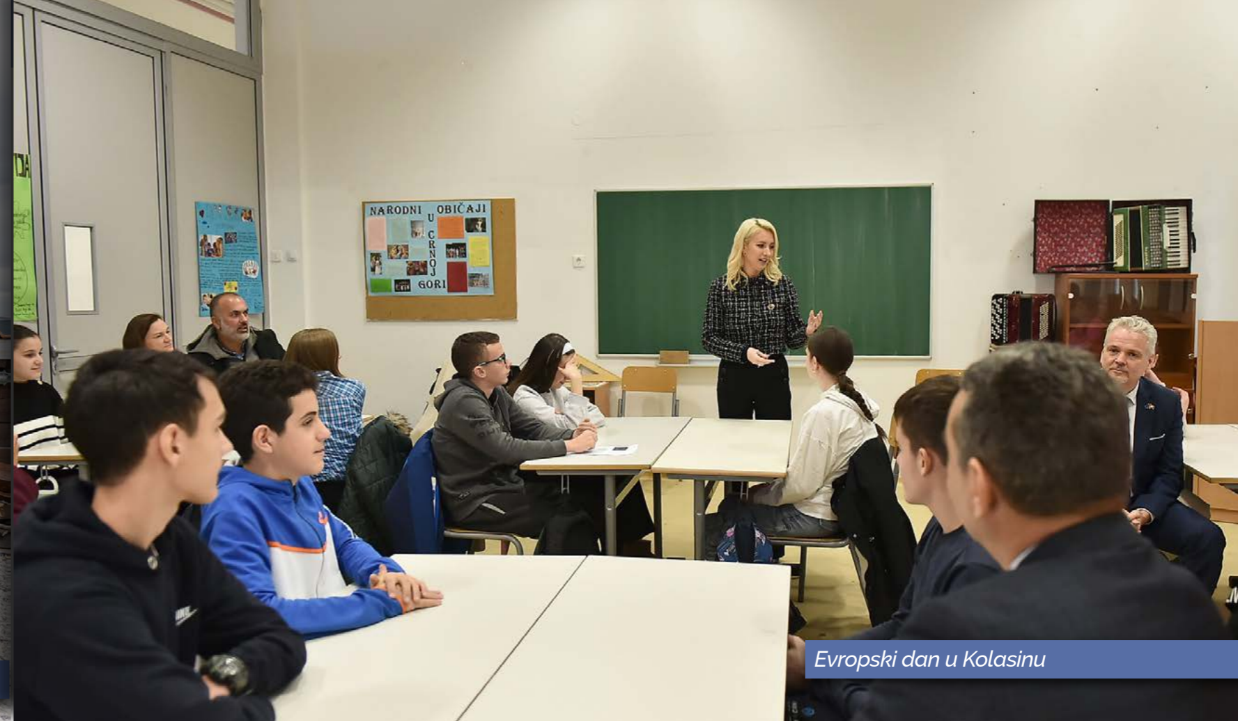
Evropski dan u Kolasinu