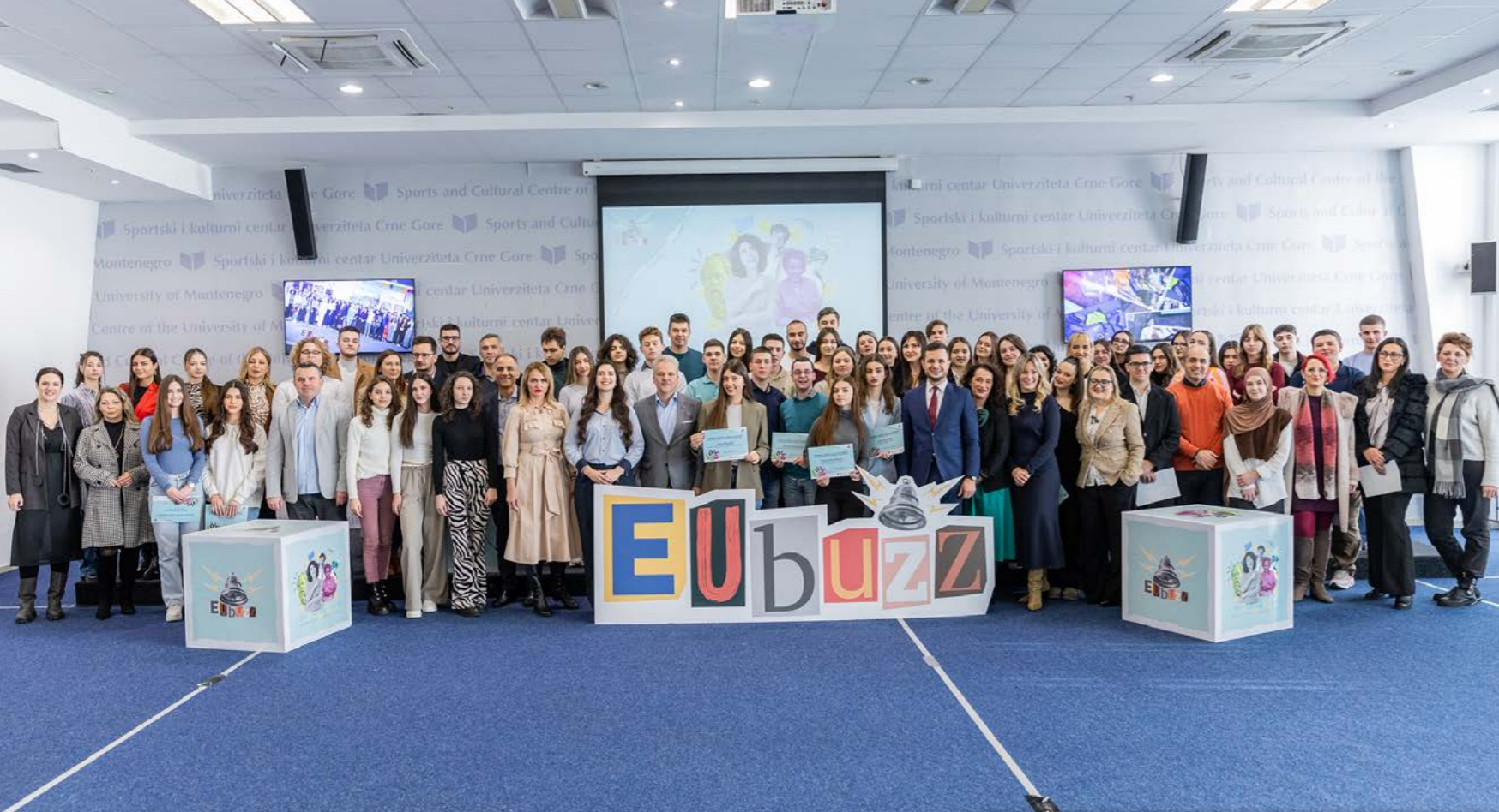
Finale EUbuzz kampanje