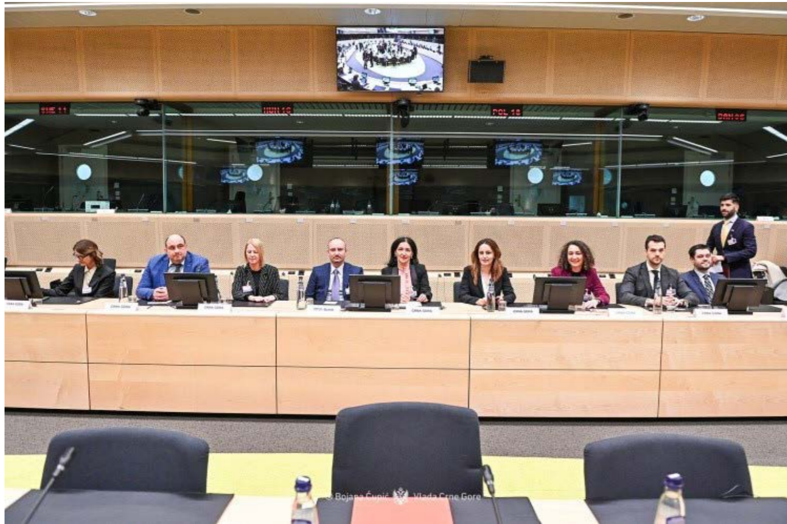
Foto: Međuvladina konferencija, Brisel, 16. decembar 2024.