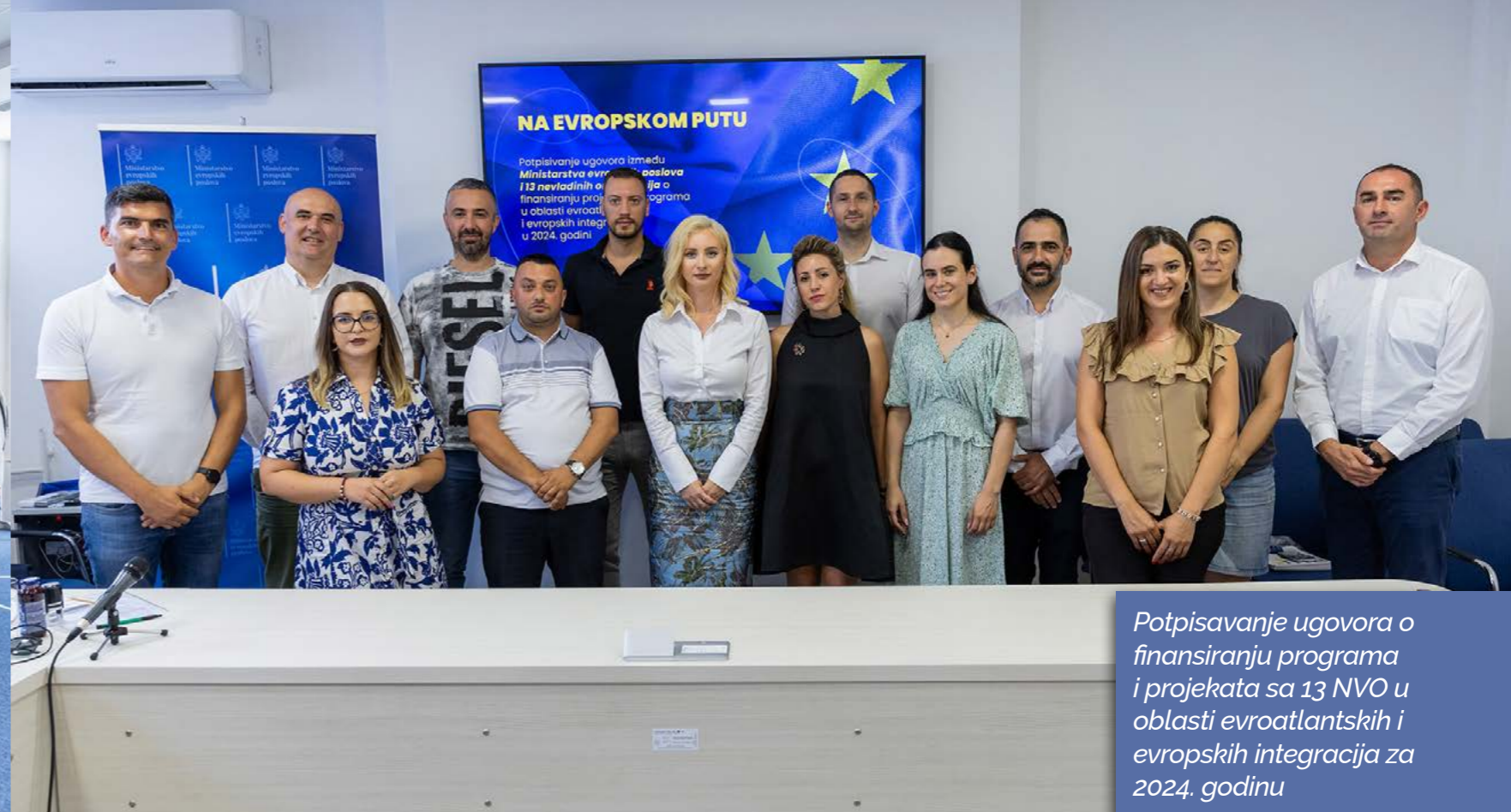
Potpisivanje ugovora o finansiranju programa i projekata sa 13 NVO u oblasti evroatlantskih i evropskih integracija za 2024. godinu