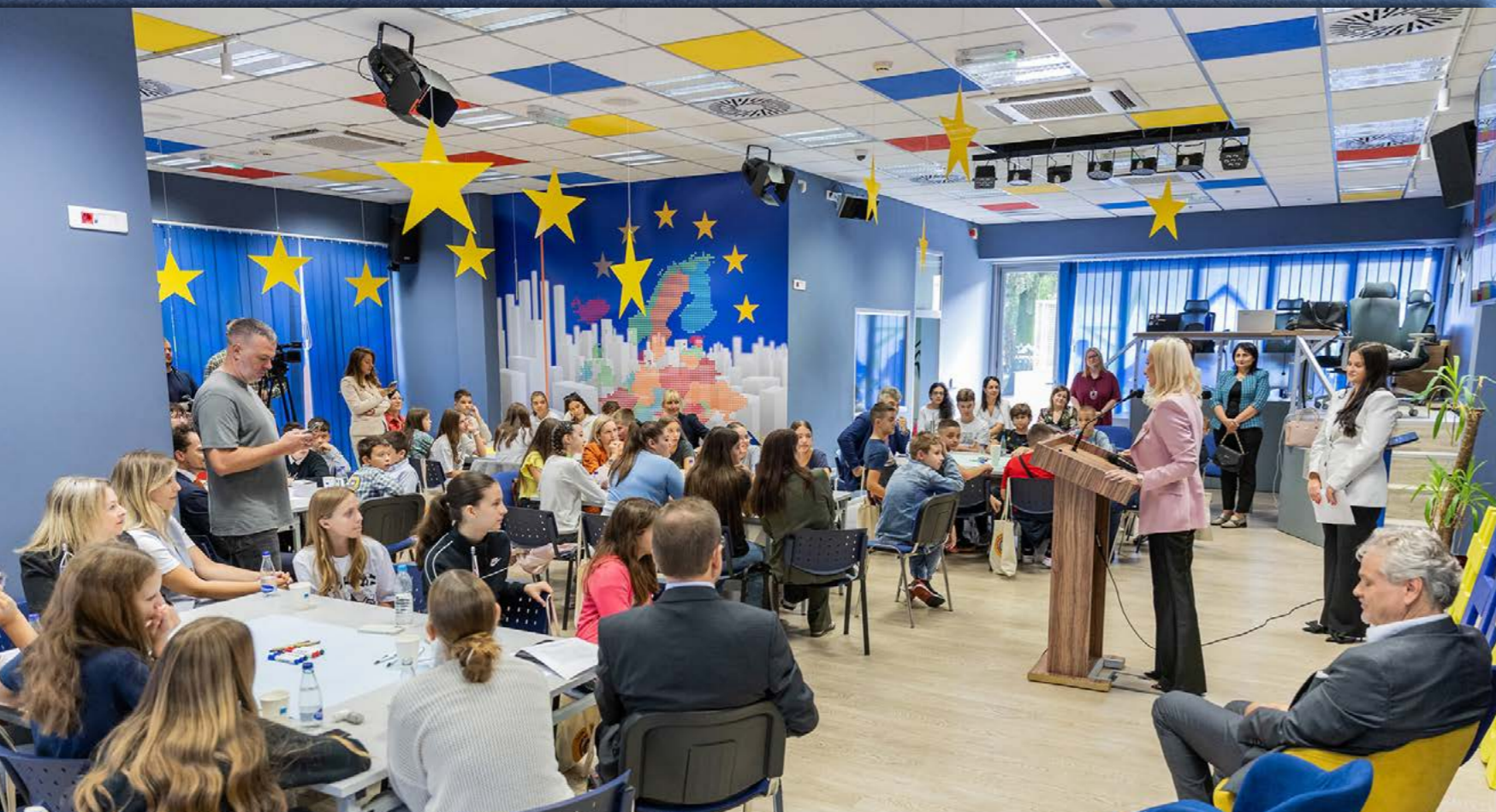
Obilježavanje Evropskog dana jezika