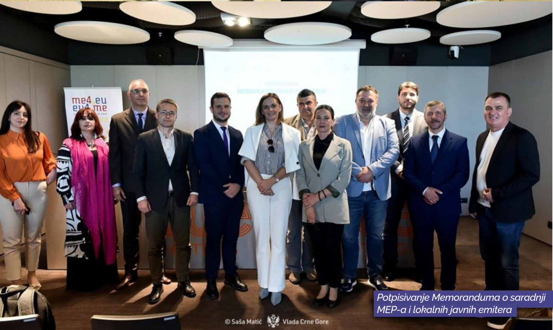
Potpisivanje Memoranduma o saradnji MEP-a i lokalnih javnih emitera