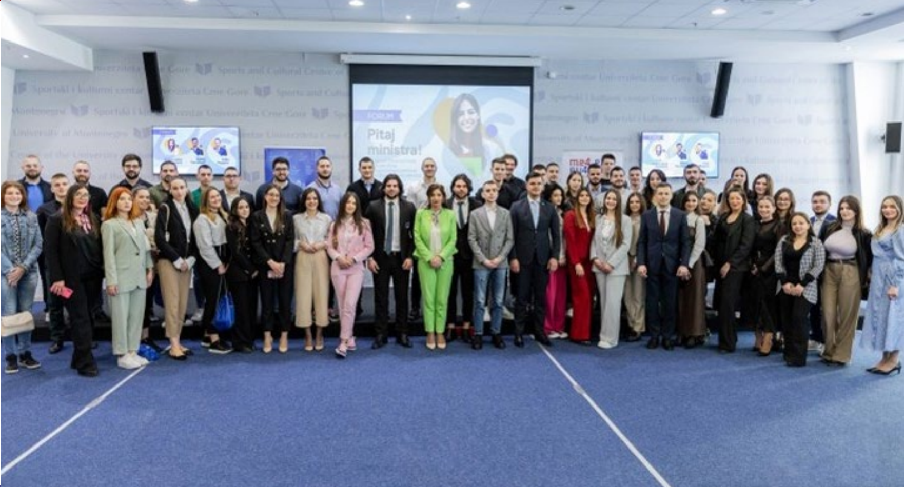
Forum „Pitaj ministra!“