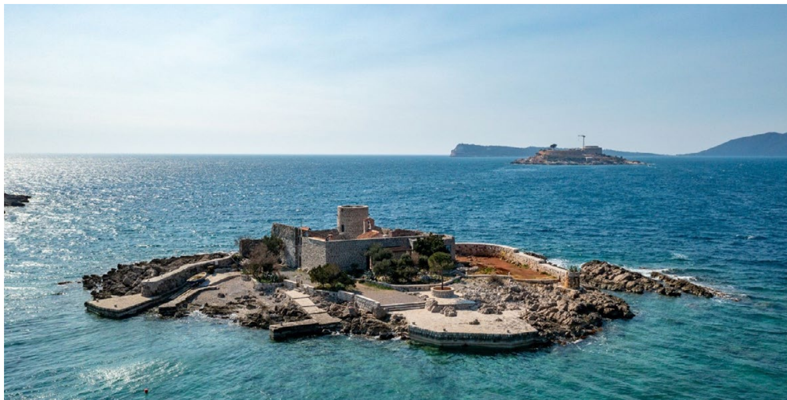
Manastir Vavedenja Presvete Bogorodice.

Osim digitalne platforme, tokom projekta je izrađena i replika prese iz Štamparije Crnojevića i drugi autentični namještaj koji je u funkciji prese. U saradnji sa Ministarstvom kulture i medija, koji je bio pridruženi partner na projektu, replika prese i namještaj dati su na upravljanje Narodnom muzeju na Cetinju i sada su izloženi u Biljardi.