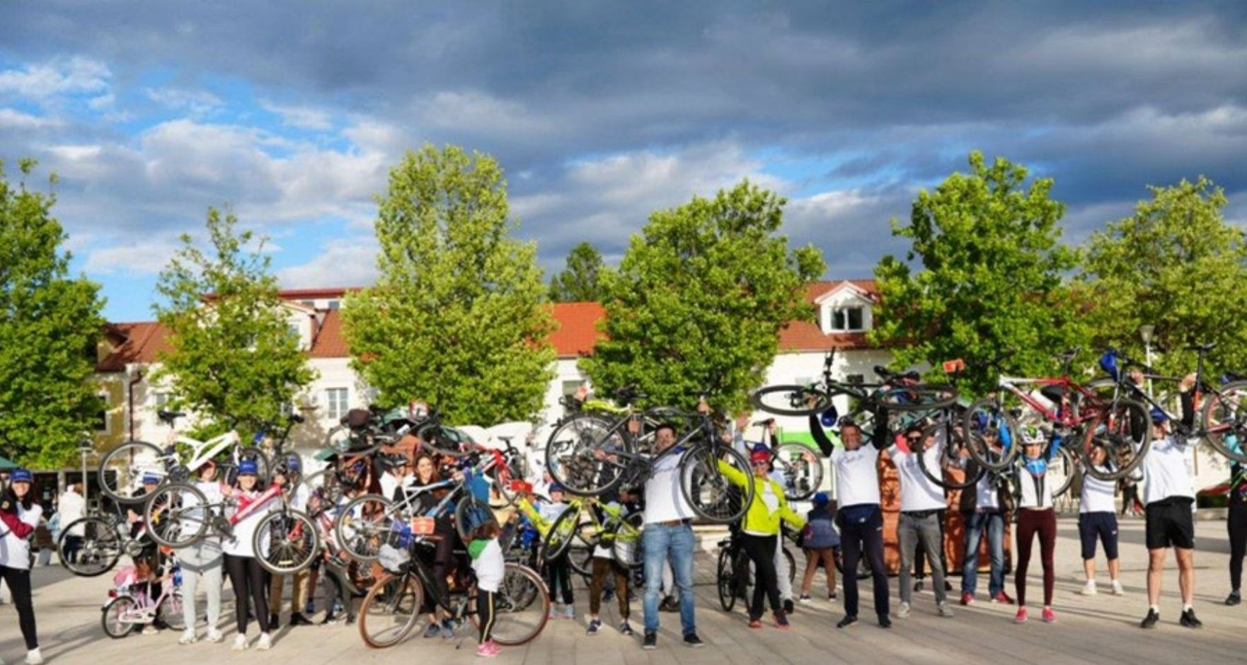
Evropski đir u Nikšiću