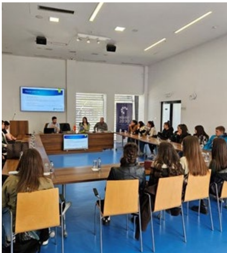
Foto: Radionica sa srednjoškolicima

godine, koje su namjenjene podizanju kapaciteta i pripremi infrastrukture u susret 2030. godini, kada će Nikšić tokom 365 dana biti jedna od najvažnijih tačaka na kulturnoj mapi Evrope.