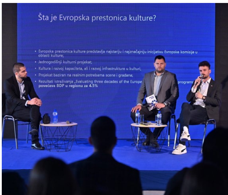
Foto: predstavljanje inicijative na Podgoričkom sajmu knjiga

upravo - da bude otvoreni prostor gdje svi mogu da se informišu o tome šta je EPK, predlože svoje projekte i doprinesu svojim znanjem, savjetima i kreativnošću. U proteklim mjesecima u Kancelariji je svoje ideje predstavilo više stotina pojedinaca, organizacija i udruženja iz Nikšića, ali i čitave Crne Gore.