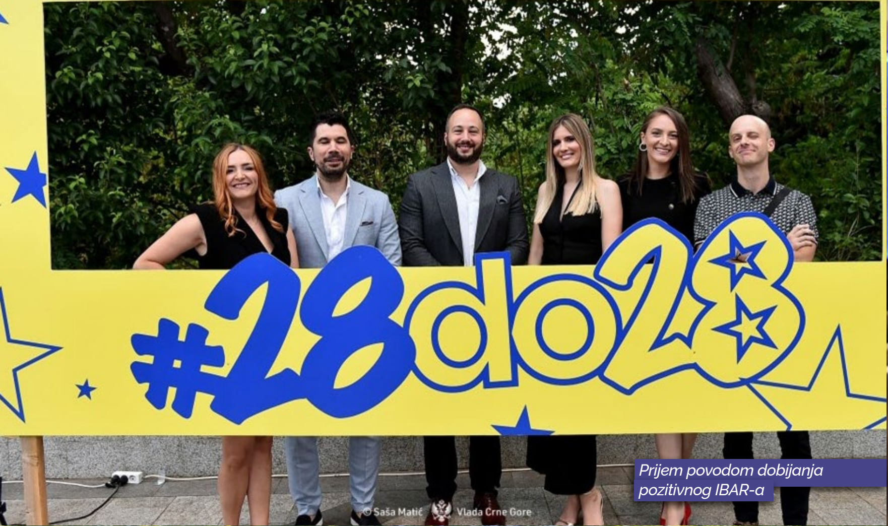
Prijem povodom dobijanja pozitivnog IBAR-a