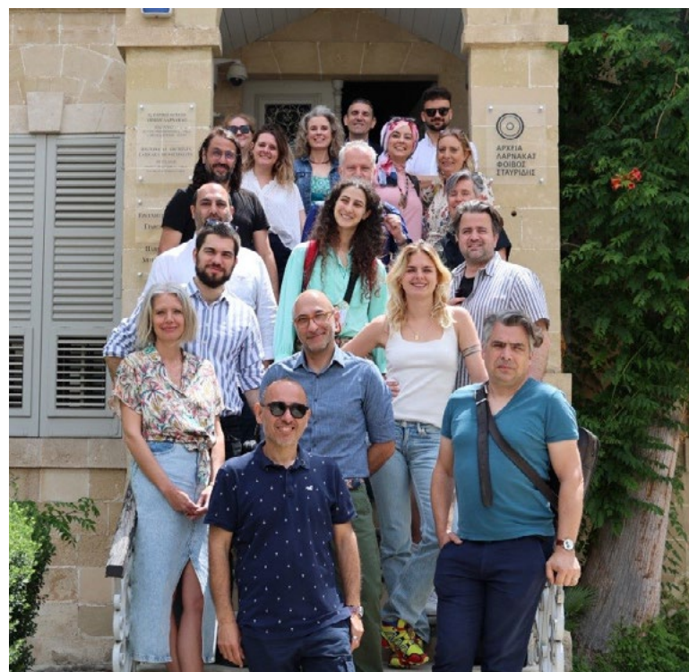
Foto: Predstavnici radnih timova EPK kandidata za 2030. na zajedničkom sastanku na Kipru

Projekat Nikšić 2030 EPK predviđa balansiran kulturni program tokom čitave godine koji će uključiti različite oblike umjetničkog izražavanja, participativne kulturne programe koji uključuju građane kao izvođače a ne samo pasivne posmatrače, kao i inovativne projekte u oblasti kulture koji su zasnovani na rekoncipiranju Nikšića kao centra kreativnih(!) industrija. Planiran je i niz pripremnih aktivnosti u periodu od 2026-2029.