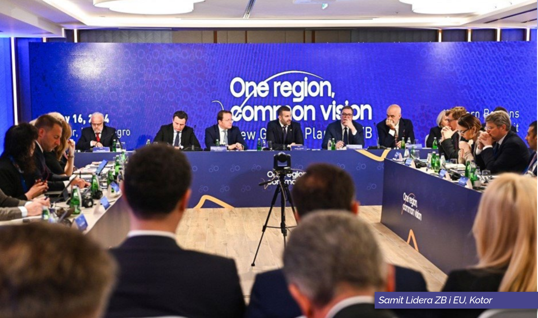
Samit Lidera ZB i EU, Kotor