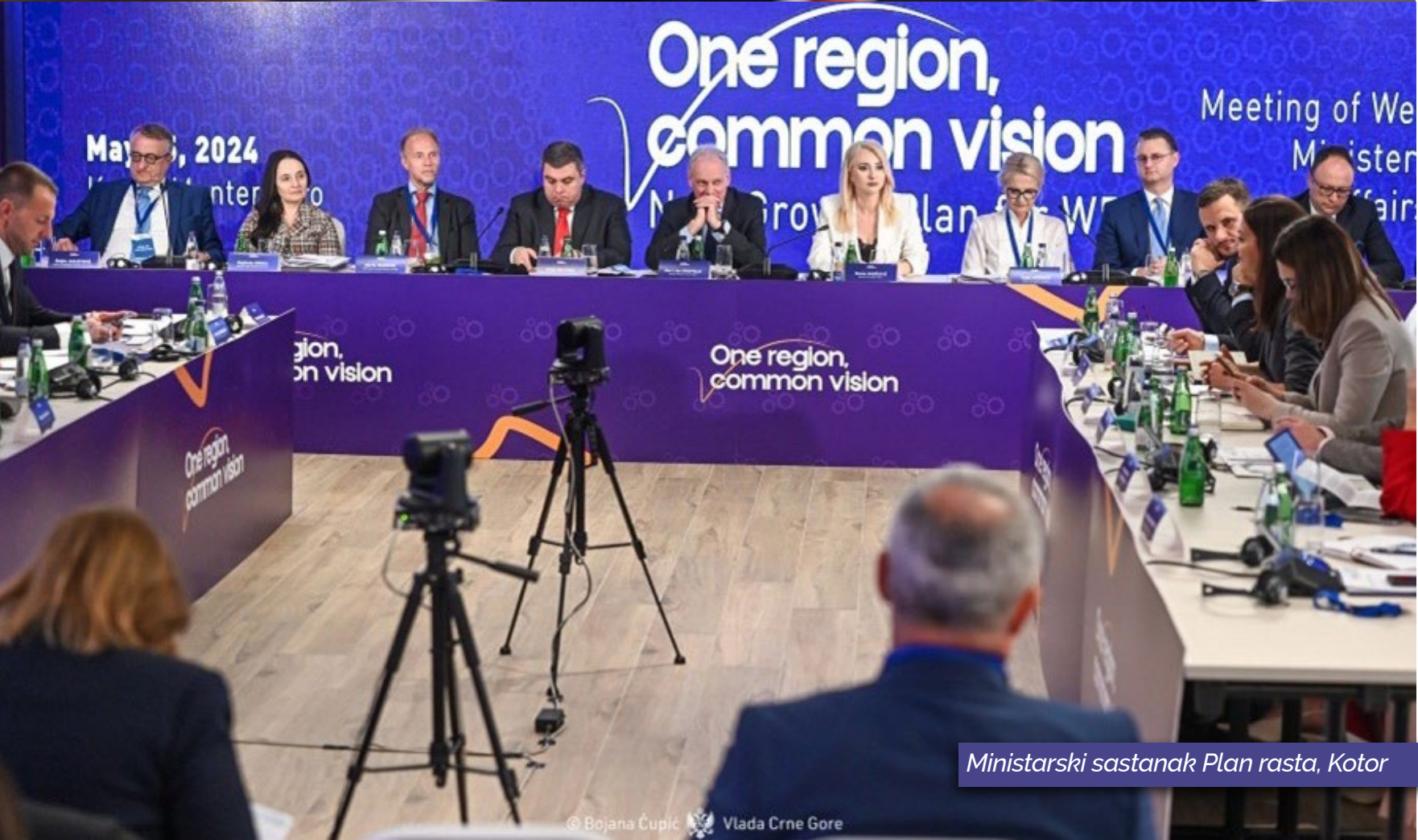
MinistarSKI sastanak Plan rasta, Kotor