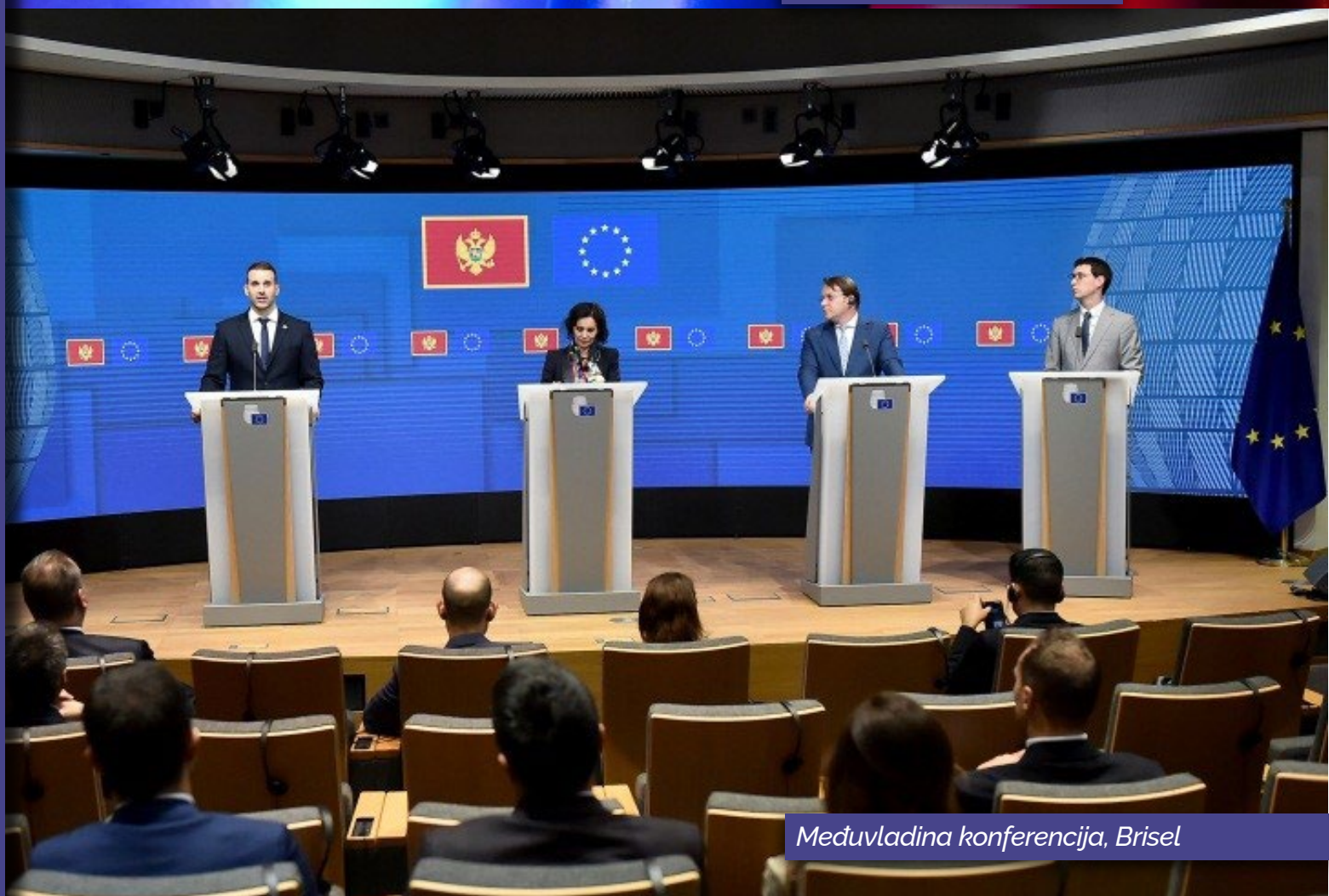
Međuvladina konferencija, Brisel