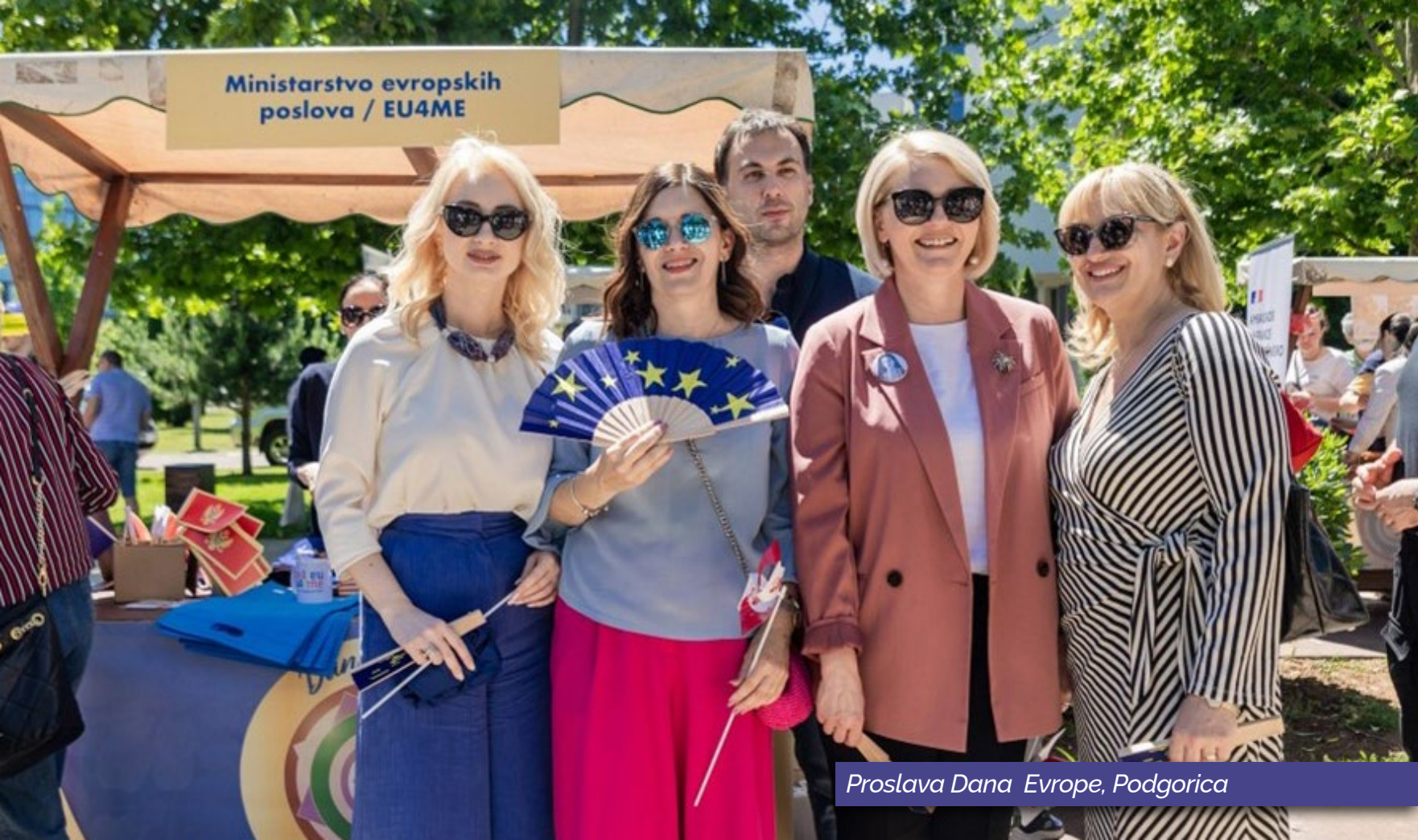
Proslava Dana Evrope, Podgorica