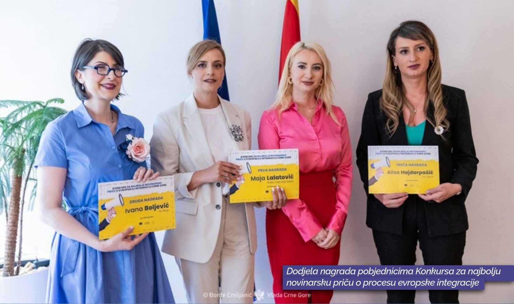
Dodjela nagrada pobjednicima Konkursa za najbolju novinarsku priču o procesu evropske integracije