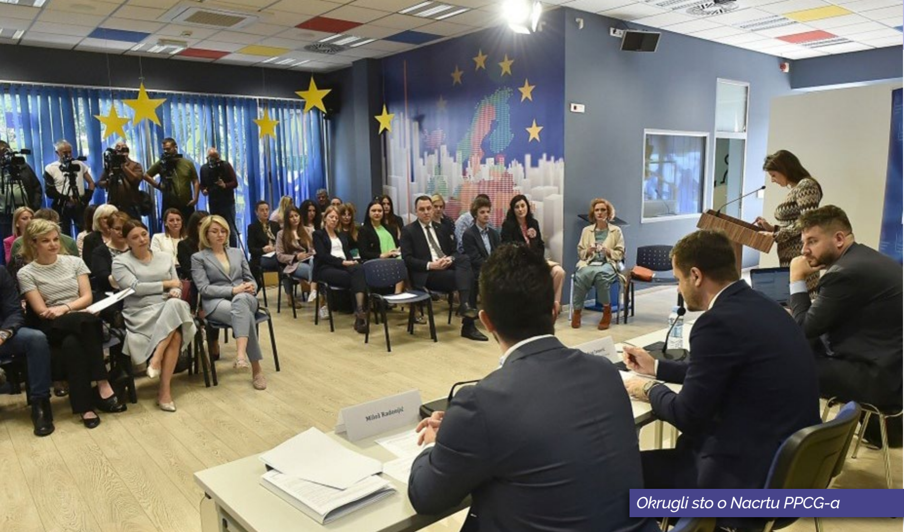
Okrugli sto o Nacrtu PPCG-a