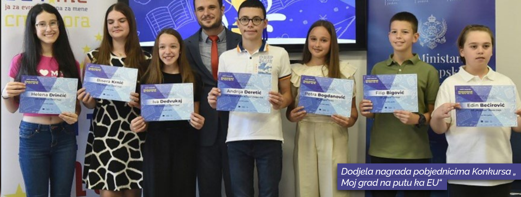
Dodjela nagrada pobjednicima Konkursa „Moj grad na putu ka EU“