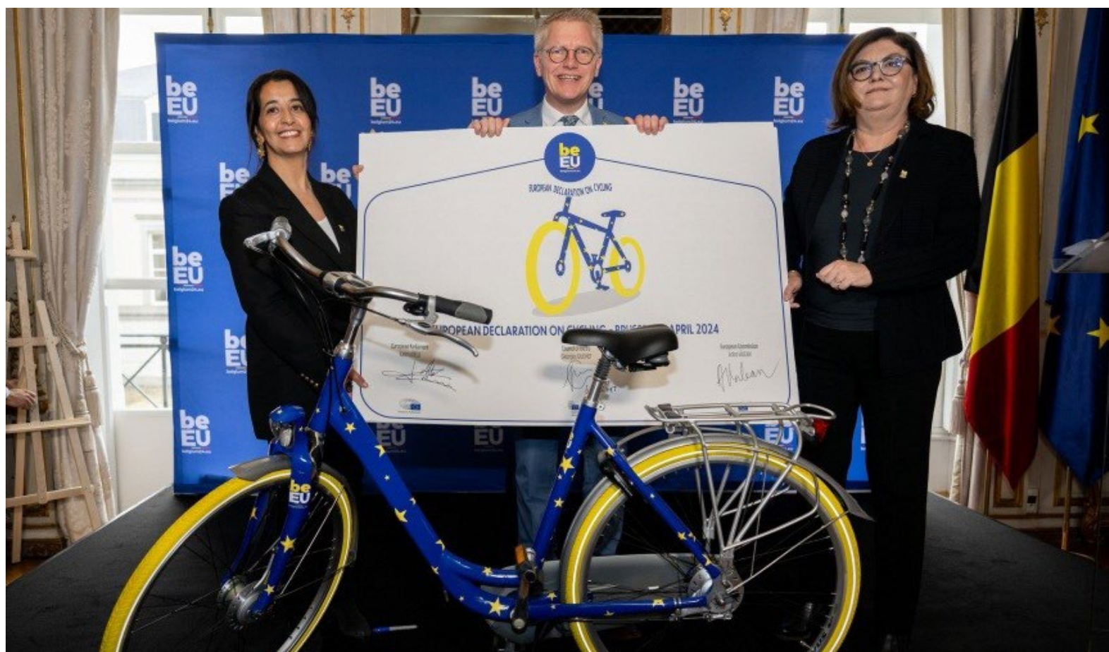
Sa potpisivanja Evropske deklaracije o biciklističkom saobraćaju.

Ključni momenat za političku podršku upotrebi bicikla bio je usvajanje Evropske deklaracije o biciklističkom saobraćaju početkom aprila 2024. godine, tokom belgijskog predsjedavanja Savjetu Evropske unije. Sve tri institucije EU – Evropski parlament, Evropska komisija i Savjet ministara EU potpisale su prvi zvanični dokument kojim se biciklo prepoznaje kao punopravni oblik transporta. U Deklaraciji se navodi da je biciklistički saobraćaj jedan od najodrživijih, najdostupnijih, najinkluzivnijih, najpristupačnijih i