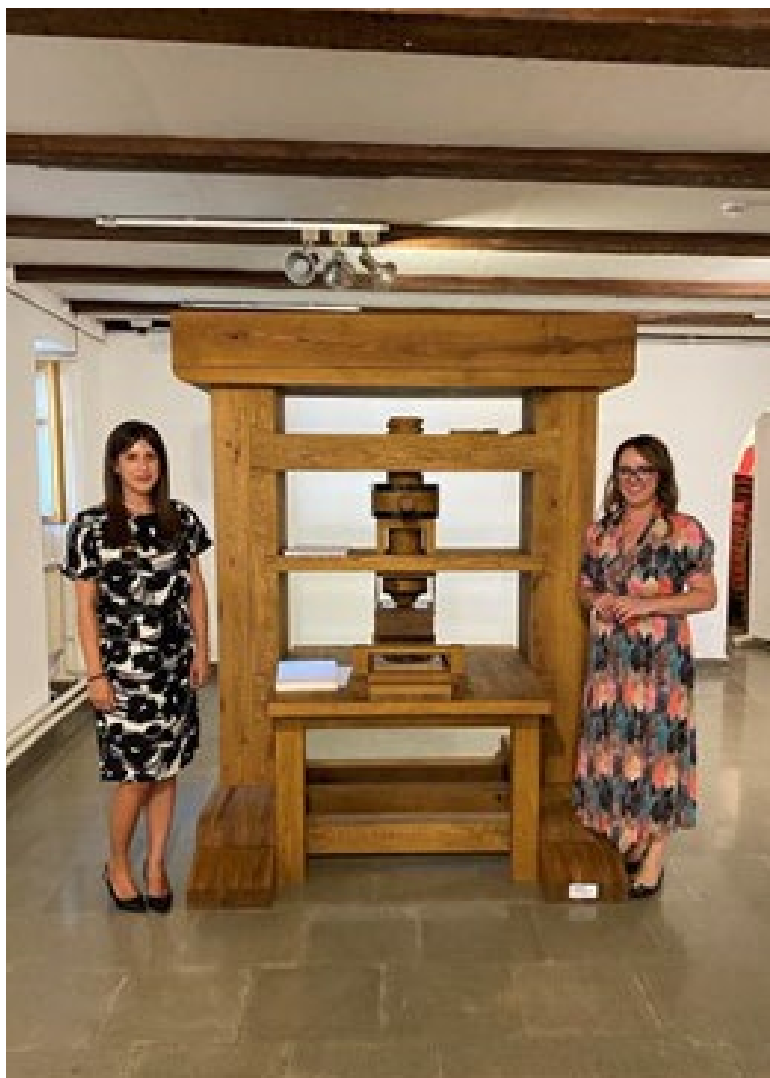
Replika prese iz Štamparije Crnojevića.

Kako navodi Kovačević, partneri iz Crne Gore su željeli da od kulturno-istorijskog nasljeđa naprave prepoznatljiv turistički proizvod.