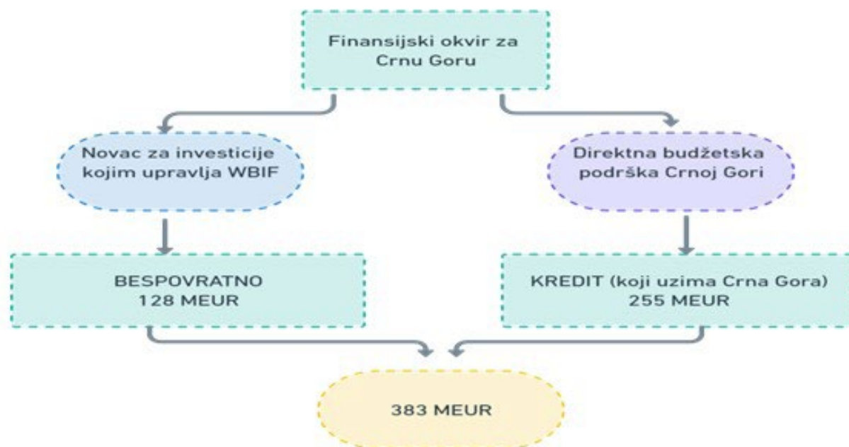
Slika 1: Finansijski okvir za Crnu Goru

Prema propisanoj metodologiji, za Crnu Goru je određen iznos od oko 383 miliona eura, u kombinaciji od oko 255 miliona eura kredita pod povoljnim uslovima i 128 miliona eura bespovratnih sredstava EU.