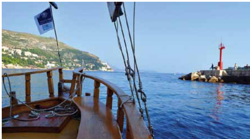
Kroz Porporelu, Dubrovnik, Republika Hrvatska

Kroz projekat će se povećati kvalitet usluge i podići nivo sigurnosti u nautičkom turizmu, prije svega izradom internetske stranice namijenjene nautičarima koji posjećuju predmetno područje, i nautičko-turističkog vodiča za jahte (jedrilice i motorne jahte) i megajahte koji će sadržati pomorske rute pograničnog područja. Vodič će sadržati posebna poglavlja za svaku turističku luku i marinu sa slikama, planovima, nautičkim informacijama (broj vezova,