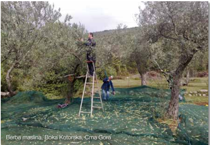
Berba maslina, Boka Kotorska, Crna Gora

Poboljšani kvalitet turističke ponude mora biti jasno vidljiv i na zaslužen način