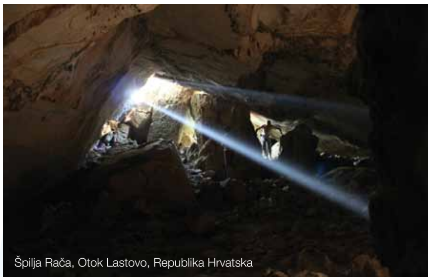
Špilja Rača, Otok Lastovo, Republika Hrvatska

Sprovođenje projekta u Crnoj Gori ogleda se u uređenju vidikovaca i postavljanju savremenih teleskopa na lokalitetima u oba nacionalna parka.