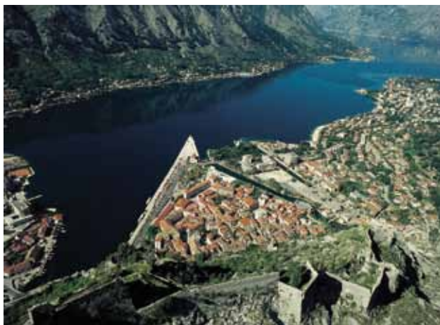
Kotorski zaljev, Crna Gora