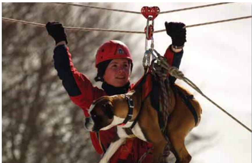
Biokovo, Republika Hrvatska - Vježba transporta žičarom

Cilj projekta je kreiranje uspješnog turističkog prekograničnog proizvoda i to prije svega formiranjem aktivnog prekograničnog „clustera“ turističkih preduzetnika, outdoor klubova (u prvom redu planinarskih) kao i predstavnika individualnih inicijativa u outdoor turizmu prekogranične regije.