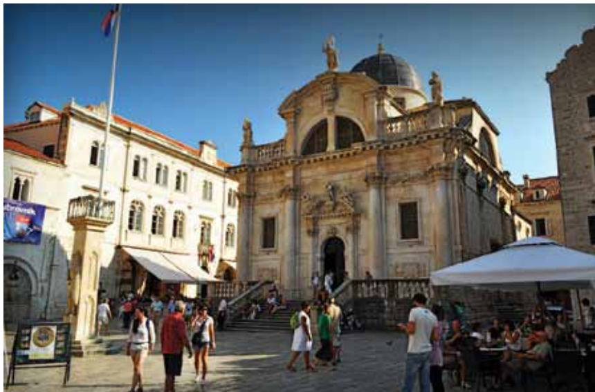
Crkva sv. Vlaho, Dubrovnik, Republika Hrvatska

Operativne strukture zajednički objavljuju Poziv za podnošenje projektnih prijedloga (eng. Call for Proposals) s Uputstvima za potencijalne aplikante (eng. Guidelines for Applicants). Poziv za podnošenje projektnih prijedloga objavljuje se periodično do 2013. godine i/ili do potpune iskorištenosti sredstava.