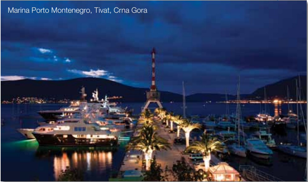
Marina Porto Montenegro, Tivat, Crna Gora

ponuda u marini, zbrinjavanje otpada itd.), turističkom ponudom (restorani, kafići itd.) i opštim servisnim informacijama (zdravstvena zaštita, prijevoz, telekomunikacije, banke i druge financijske usluge itd.).