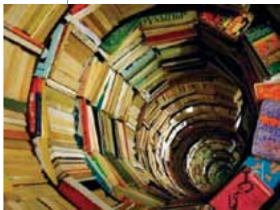
U vrtlogu znanja...