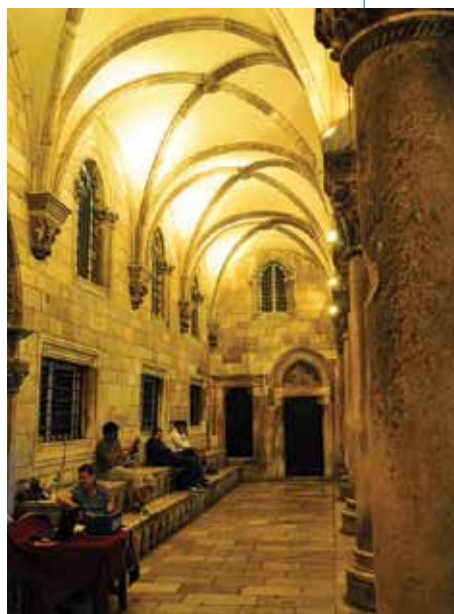
Ulaz u Knežev dvor, Dubrovnik, Republika Hrvatska

Od mjera finansiranih pod IPA prekograničnom saradnjom obje strane moraju imati koristi pa su zbog toga neophodni zajednički programi, zajedničko upravljanje, zajedničko finansiranje i zajednička implementacija projekata . IPA prekogranična saradnja ima za cilj promovisanje saradnje i progresivnu ekonomsku integraciju između EU i zemalja kandidata/potencijalnih kandidata.