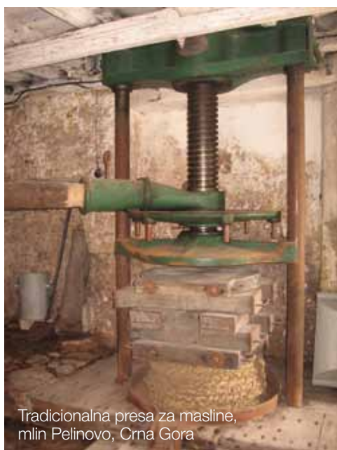
Tradicionalna presa za masline, mlin Pelinovo, Crna Gora