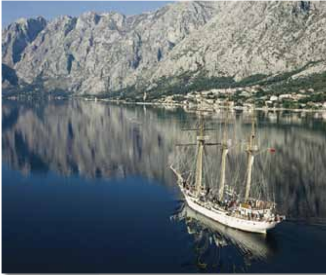
Boka Kotorska, Crna Gora

Za period 2007 – 2013. godine EU je otvorila novi program IPA koji predstavlja jedinstveni finansijski instrument za finansiranje programa između zemalja članica EU i zemalja kandidata ili potencijalnih kandidata za članstvo. Jedan od programa pod IPA komponentom II, pod nazivom Prekogranični program Hrvatska - Crna Gora, pruža podršku projektima koji se odnose na prekograničnu saradnju pograničnih regija Republike Hrvatske i Crne Gore.