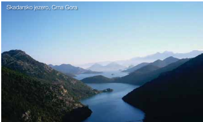
Skadarsko jezero, Crna Gora

Po završetku projekta na Lastovu će biti uređen vidikovac, a u Primorju, u Majkovima, objekat u službi obrazovnog centra herpetološkog rezervata. Očistiće se zaštićene lokve s kornjačama pored Baćinskih jezera i moći će se uživati u novouređenoj turističkoj stazi sa klupama za odmor i info pločama, a u Cavtatu posjetiti špilja Šipun, čije je uređenje i otvaranje za javnost takođe finansirano ovim projektom, kao i uređenje, opremanje i prezentacija Nacionalnih parkova Lovćen i Skadarsko jezero.