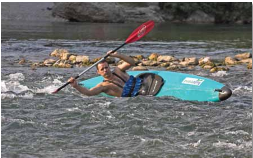
Kajak na rijeci, jezeru, moru