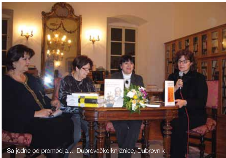
Sa jedne od promocija..., Dubrovačke knjižnice, Dubrovnik

Postavljanje internetske stranice: Internetska stranica Gradske biblioteke i čitaonice Kotor je www.bibliotekakotor.me u upotrebi je od februara 2011. godine.