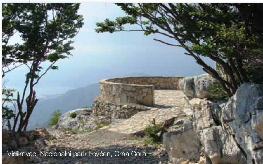
Vidikovac, Nacionalni park Lovćen, Crna Gora

Uređenje staze koja vodi do Obodske pećine na Skadarskom jezeru, bi-ospeleološka i arheološka ispitivanja pećina Skadarskog jezera, nabavka informatičke opreme, izrada Studije bioraznolikosti za odnosna područja u Crnoj Gori, samo su dio ukupne implementacije projekta finansiranog iz IPA Programa prekogranične saradnje Hrvatska – Crna Gora.