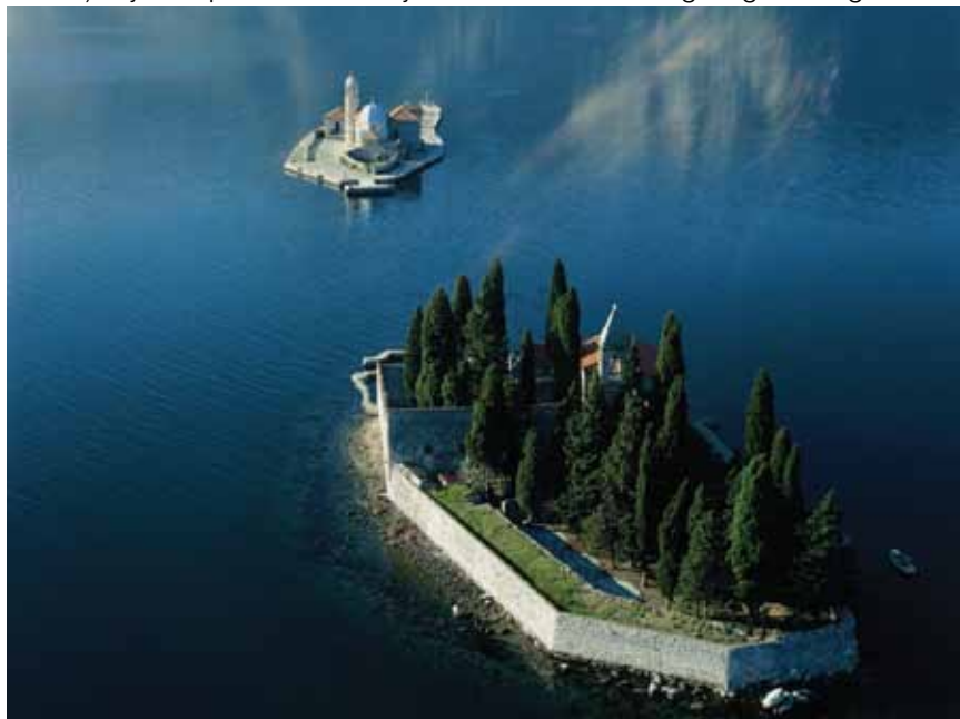
Peraška ostrva, Sveti Đorđe i Gospa od Škrpijela, Crna Gora

Konačnu odluku o odabiru projekata koji će se finansirati kroz Program donosi Zajednički odbor za praćenje Programa (eng. Joint Monitoring Committee – JMC ) koji čine predstavnici objiju država s nacionalnog i regionalnog nivoa.