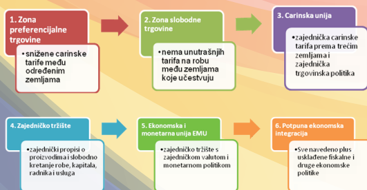
Grafik 1: Razvoj ekonomskih integracija u EU

Članice Evropske unije (EU) koje su prihvatile euro kao zajedničku valutu čine Evropsku monetarnu uniju (EMU) . Monetarna unija predstavlja najviši nivo monetarnih integracija, a zasniva se na: harmonizaciji monetarnih politika zemalja članica i uvođenju jedinstvene valute, zajedničkim monetarnim rezervama, zajedničkoj centralnoj banci i jedinstvenoj monetarnoj politici. Formiranje EMU je rezultat dugogodišnjih težnji, monetarnog ujedinjavanja sa ciljem obezbjeđenja zadovoljavajućeg nivoa finansijske stabilnosti i stabilnosti cijena zemalja članica EMU.